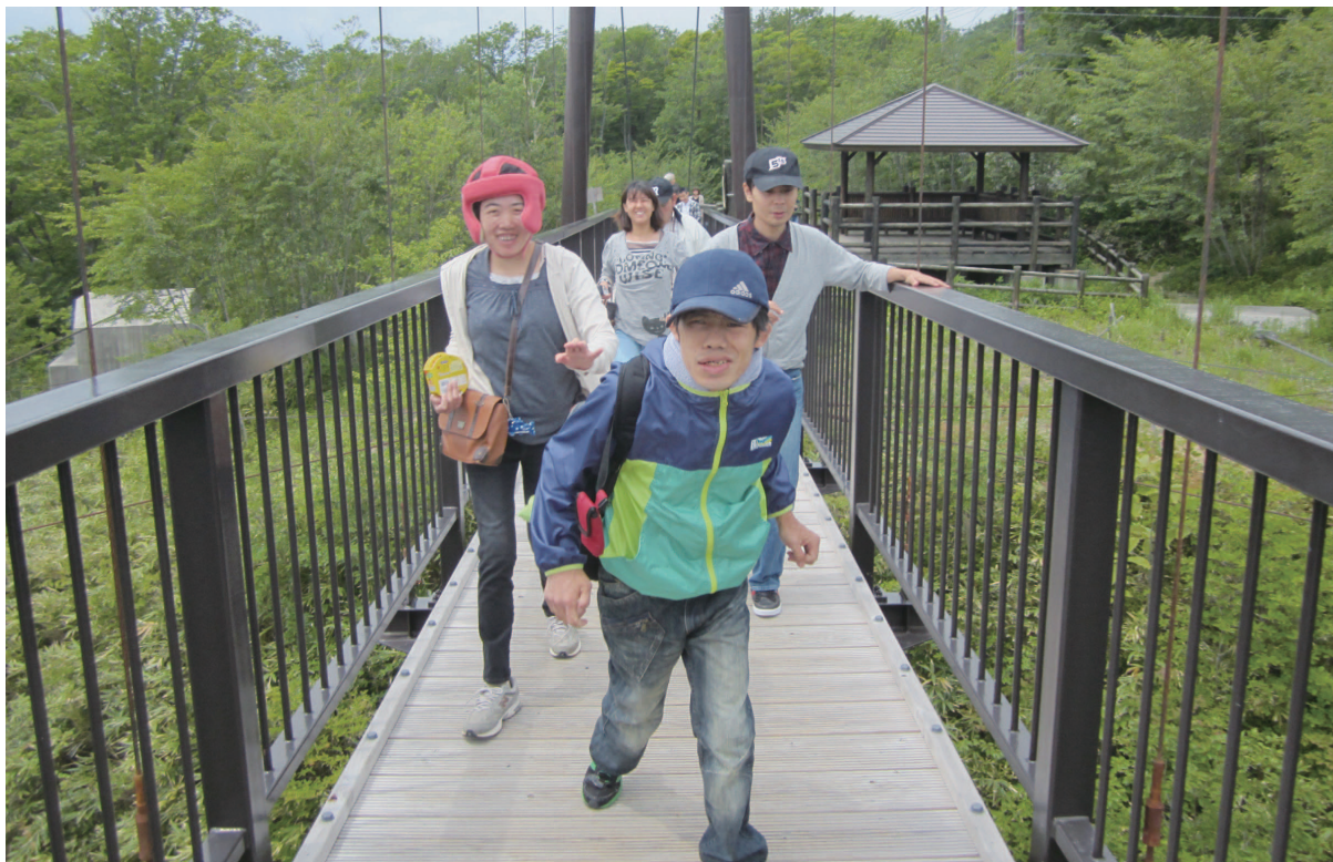
那須方面 1泊旅行にて